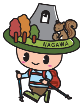
長和町イメージキャラクター なっちゃん